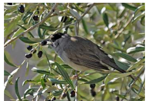
Fauvette à tête noire ( Sylvia atricapilla )