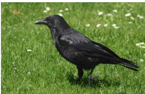
Corneille noire ( Corvus corone )