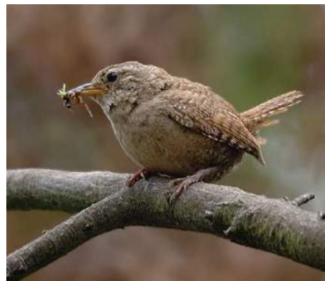
Troglodyte mignon ( Troglodytes troglodytes )