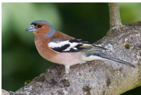
Pinson des arbres ( Fringilla coelebs )