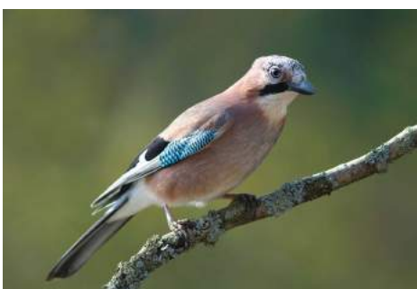
Geai des chênes ( Garrulus glandarius )