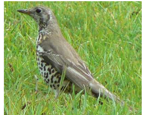
Grive draine ( Turdus viscivorus )