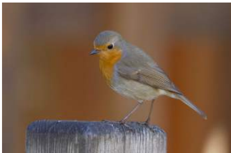
Rouge-gorge familier ( Erithacus rubecula )