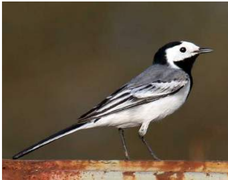
Bergeronnette grise ( Motacilla alba )