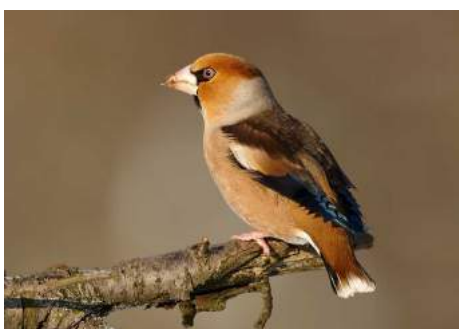
Gros-bec casse-noyaux ( Coccothraustes coccothraustes )