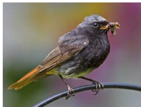
Rougequeue noir ( Phoenicurus ochruros )