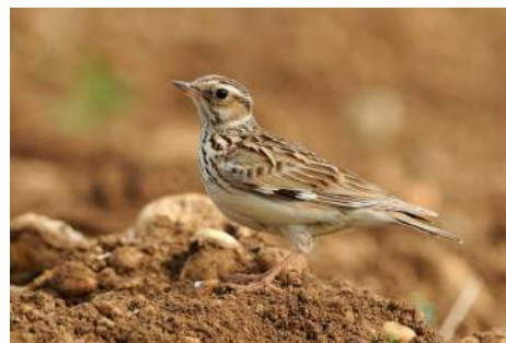
Alouette lulu ( Lullula arborea )