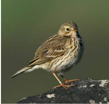
Pipit farlouse ( Anthus pratensis )