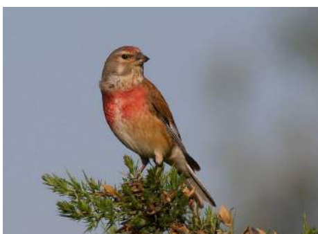
Linotte mélodieuse ( Carduelis cannabina )