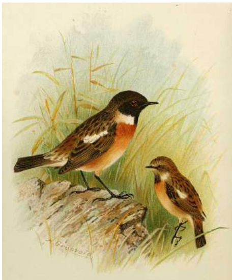
Tarier pâtre ( Saxicola rubicola )