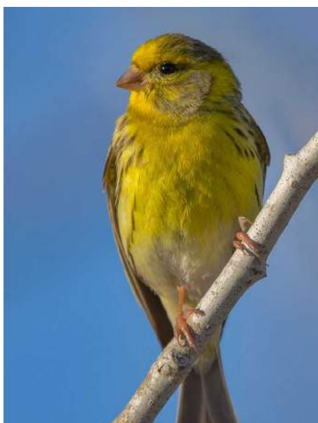
Serin cinis ( Serinus serinus )