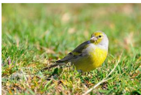
Venturon montagnard ( Carduelis ou Serinus citrinella )