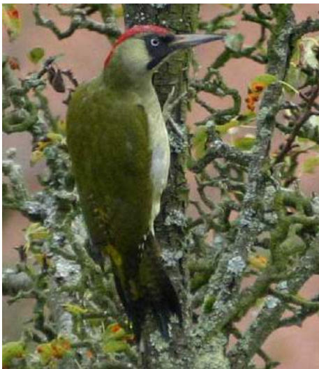
Pic vert ( Picus viridis )