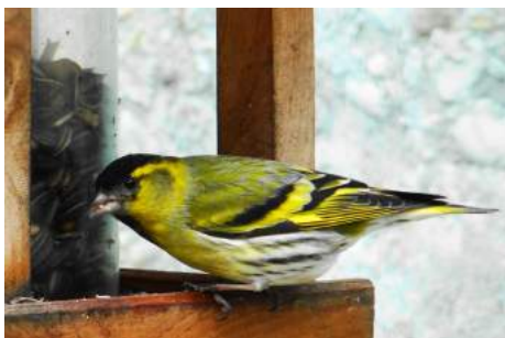
Tarin des aulnes ( Carduelis spinus )