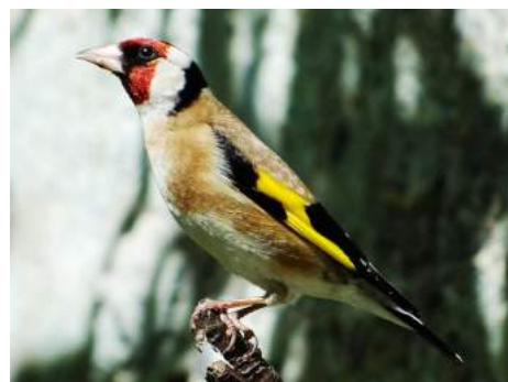
Chardonneret élégant ( Carduelis carduelis )