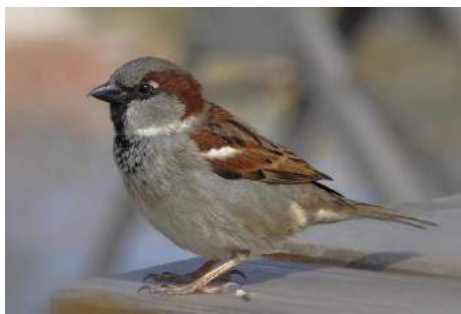
Moineau domestique ( Passer domesticus )