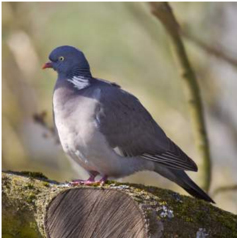
Pigeon ramier ( Columba palumbus )