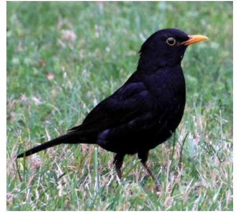
Merle noir ( Turdus merula )