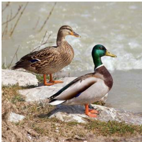
Héron cendré ( Ardea cinerea )