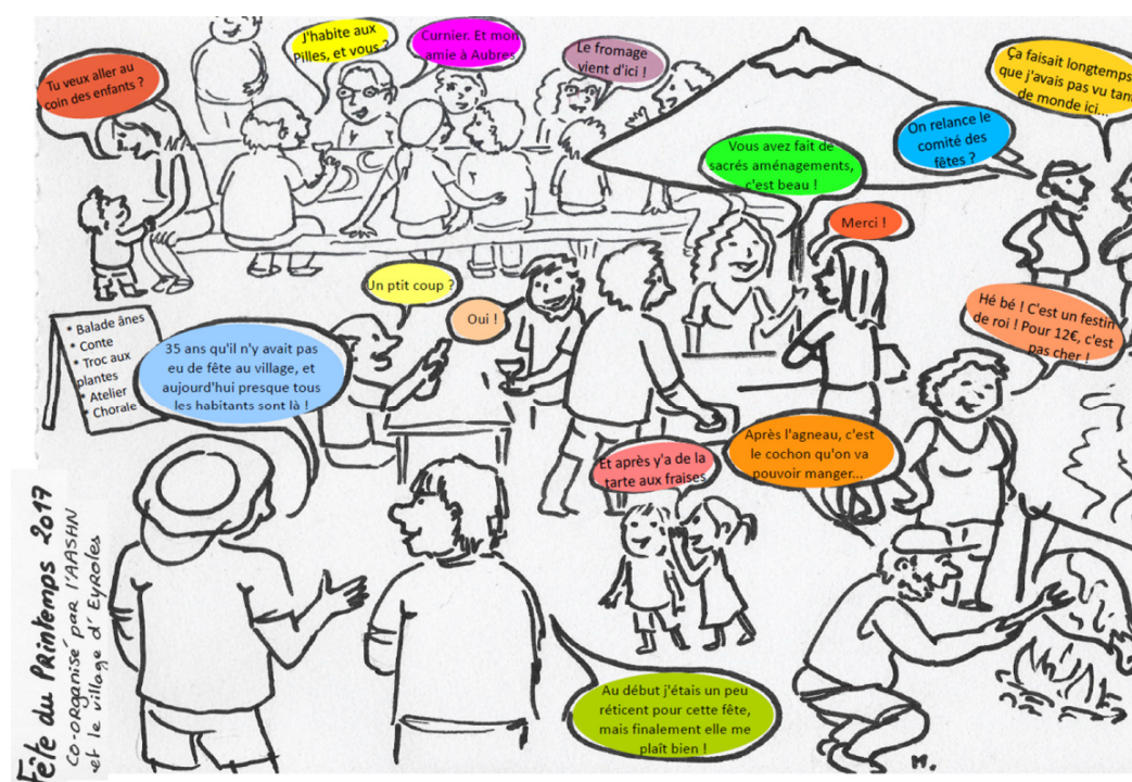
dessin de Marie Fernandez qui illustre la Fête du printemps d'Eyroles

La Fête du Printemps à Eyroles le 21 mai organisée en partenariat avec la mairie. Journée organisée autour d'un méchoui, stand de producteurs, balade contée avec des ânes, jeux de Misstigri, espace enfants, Troc de plantes, orgue de barbarie, chorale « Chœur d'Adoo », expo photos anciennes, espace enfants, atelier arts plastiques, conteur ... 120 participants, la quasi-totalité du village réuni, 76 repas servis.